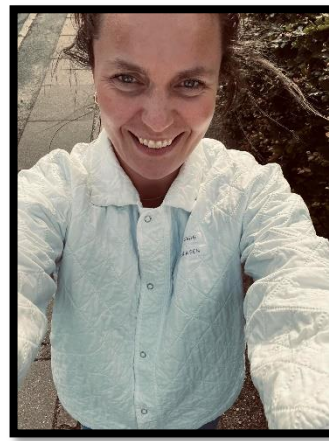
Fie Stegger TR OUH Svendborg